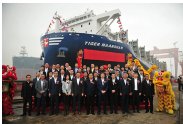
“TIGER LONGKOU”轮和“TIGER MAANSHAN”轮出坞仪式